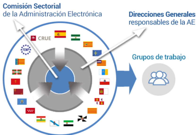
Ilustración 2. Modelo de Gobernanza TIC a nivel nacional

En primer lugar, hay que tener en consideración que la colaboración en el ámbito TIC se encuentra circunscrita a un órgano de competencias más amplias: la Conferencia Sectorial de la Administración Pública. Éste es el órgano de cooperación en materia de administración pública entre la Administración General del Estado, de las Administraciones de las Comunidades Autónomas, de las Ciudades Autónomas de Ceuta y Melilla y de la Administración Local. Su organización y funcionamiento se rigen por la Resolución de 16 de noviembre de 2018, de la Secretaría de Estado de Función Pública, por la que se publica el “Acuerdo de la Conferencia Sectorial de Administración Pública, por la que se aprueba el Reglamento de Organización y Funcionamiento” ( BOE de 17 de noviembre de 2018 ) 29